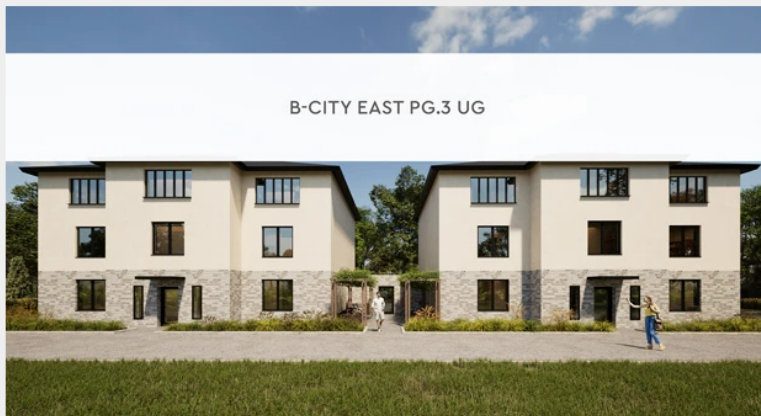
B-CITY EAST PG.3 UG